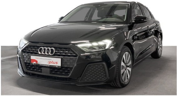
Audi Hamburg Süd VGRHH GmbH