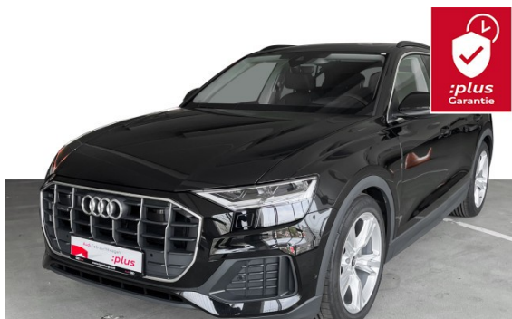
Audi Hamburg Nord VGRHH GmbH