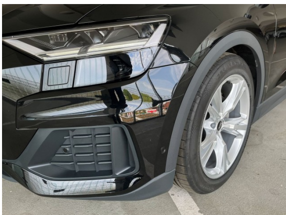
Audi Gebrauchtwagen :plus