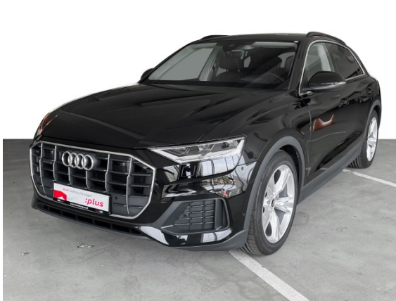
Audi Gebrauchtwagen :plus