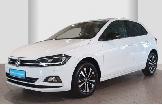
Volkswagen Automobile Hamburg Glinder Weg | 040 / 72 77 92 - 22