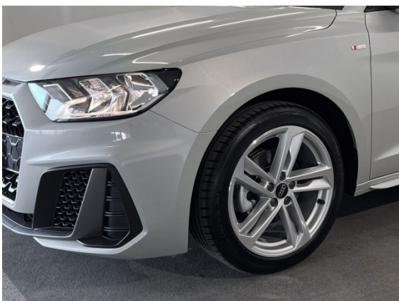
Audi Gebrauchtwagen :plus