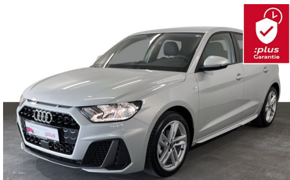
Audi Hamburg Nord VGRHH GmbH