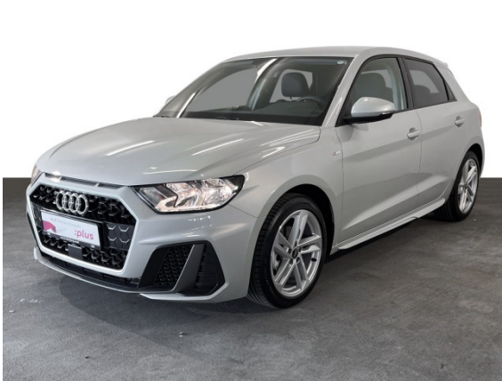
Audi Gebrauchtwagen :plus