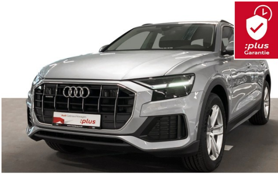
Audi Hamburg Süd VGRHH GmbH