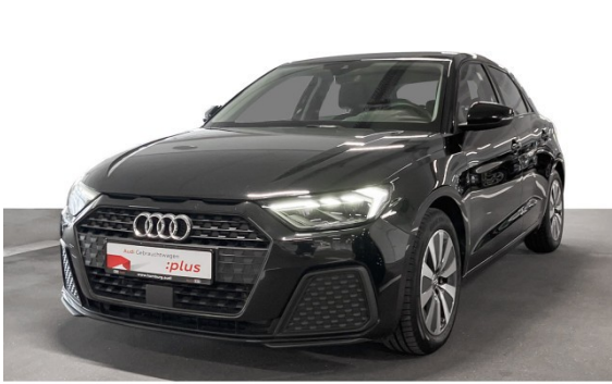
Audi Hamburg Süd VGRHH GmbH