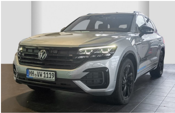
Volkswagen Automobile Hamburg Wiesendamm | 040 / 270 798 - 667