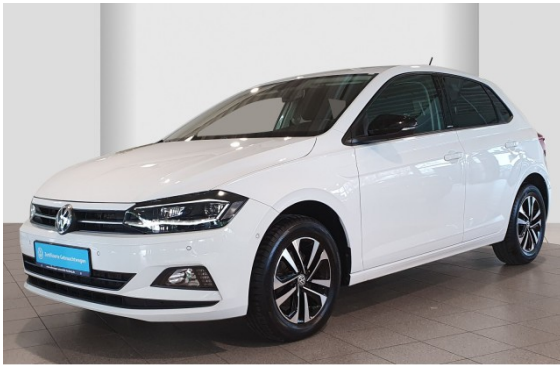
Volkswagen Automobile Hamburg Glinder Weg | 040 / 72 77 92 - 22